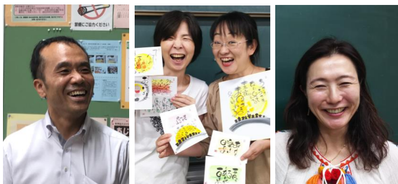
目が輝く己書幸座 笑顔に生命力が満ちてます！ありがとう♪

経済産業省より 登録番号 01000829 号 厚生労働省より 発医政 0321 第 4 号 それぞれより承認いただきました